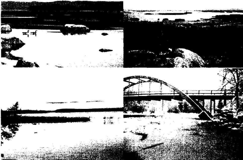
Vår vid Björso, sommar vid Avholm, höst vid Blodmyra, vinter vid Norrboån